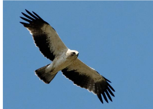
Morphe claire, © G. Fauvet