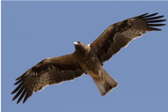
Morphe sombre